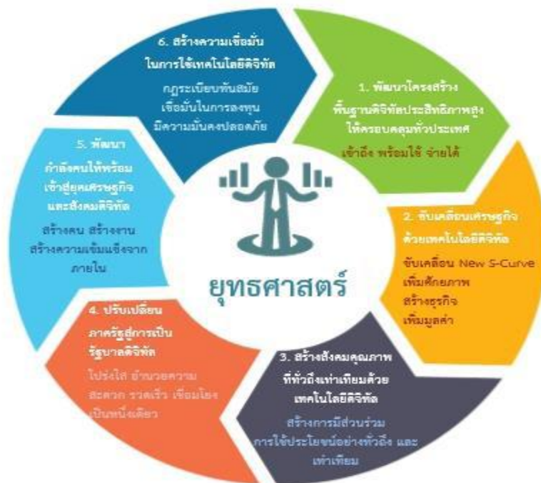
ภาพยุทธศาสตร์การพัฒนา ๖ ด้าน ของแผนพัฒนาดิจิทัลเพื่อเศรษฐกิจและสังคม